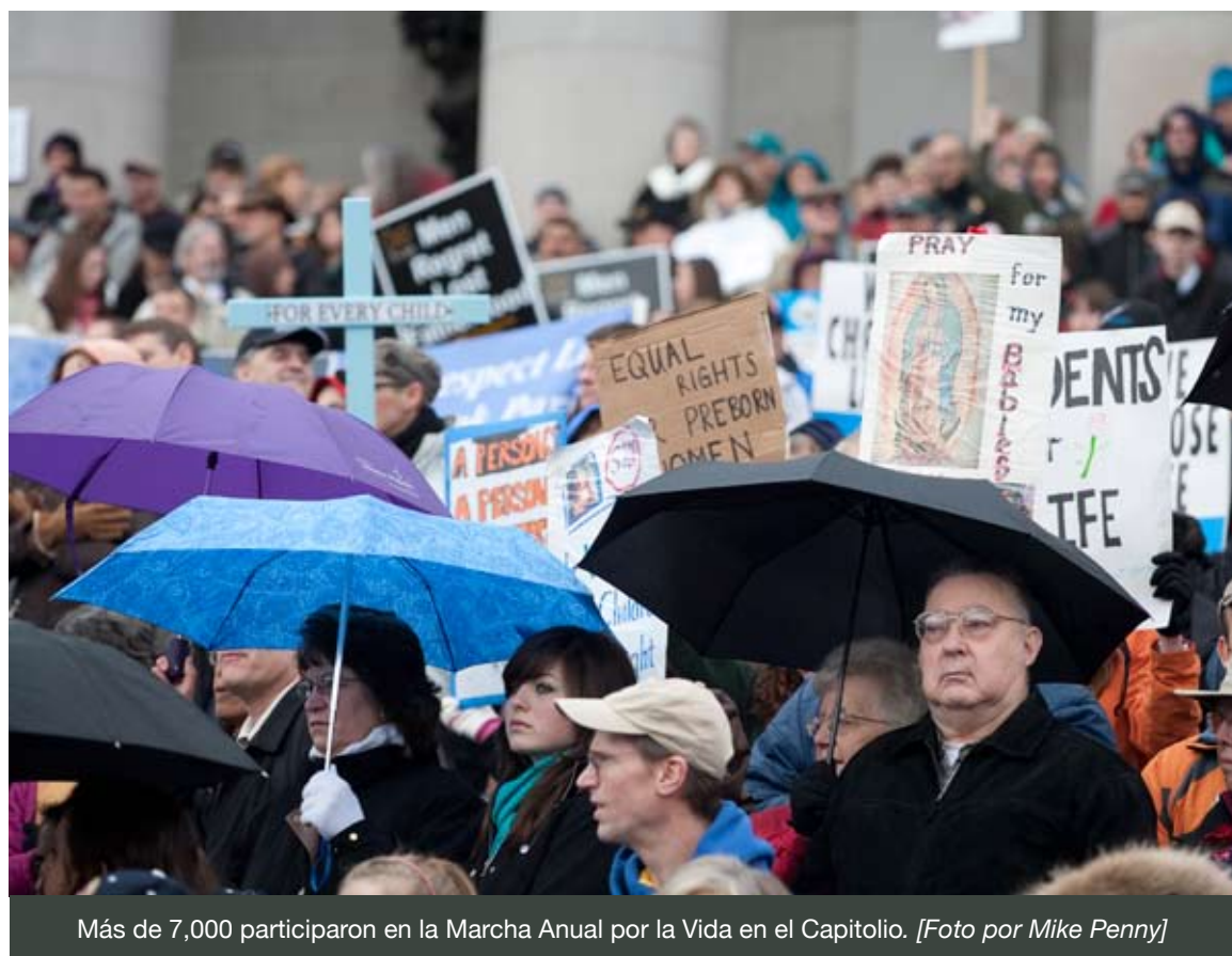
Más de 7,000 participaron en la Marcha Anual por la Vida en el Capitolio.

Kevin Birnbaum de “The Progress” contribuyó a esta historia. •