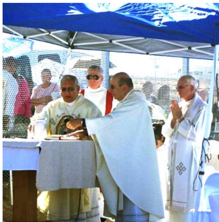
Cada 2 de noviembre, en Día de los Muertos, los tres obispos de Juarez, México, El Paso, y Las Cruces celebran la Eucaristía juntos. Dos mesas en ambos lados de la frontera simbolizan un solo altar.

Ya que la mayoría de las más de 90 nacionalidades que diariamente cruzan nuestra frontera, proviene de las Américas, es nuestra misma latinidad la que está siendo atacada. Se sabe que las causas raíces de la inmigración incluyen pobreza, salarios injustos, subempleo, y corrupción política y militar de los países de origen. Sin embargo, como Latinos y Latinas traemos una perspectiva más global del sufrimiento y la justicia que proféticamente aclara nuestra relación común entre Estados Unidos y los países de origen, señalan nuestra responsabilidad compartida de las condiciones por las que los inmigrantes cruzan nuestras fronteras. Y ni siquiera nos da vergüenza. Cuando una sociedad miente así, esconde sus valores para promover políticas reprensibles que perpetúan injusticias y de este modo destruyen la vereda para el bien común de todas las personas en la nación. No es un secreto que una vez que lo más de 12 millones