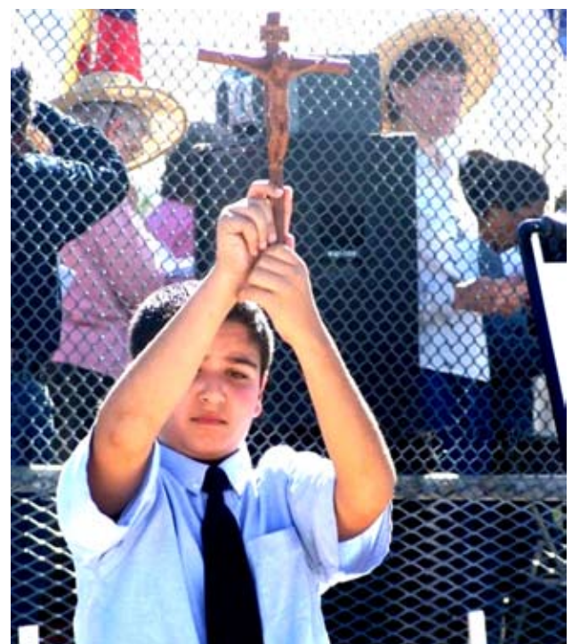
Alumno de la escuela de la escuela católica San Pío X de El Paso sostiene un crucifijo durante un momento de oración.