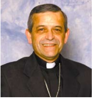
+Eusebio Elizondo M.Sp.S. Obispo Auxiliar de Seattle

A lo largo de la historia de la humanidad, podemos constatar orgullosamente que hemos logrado grandes progresos en todas las áreas de la vida. Estos avances son claras manifestaciones de la siempre sorprendente inteligencia del ser humano y del inconmensurable potencial del corazón, sobre todo en su capacidad para aceptar o rechazar las situaciones de nuestro mundo y nuestra vida.