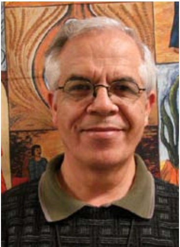
POR JOSÉ RAMÍREZ-LOMELÍ

Nuestras amistades nos lo repetían cuando algo nos parecía de mal gusto. En particular cuando algo molestaba... parecía un clavo doloroso, insensible, descomunal... pero redentor al fin. Nos incomodaba al punto de hacernos pensar y repensar, saborear y pasar aquel trago amargo. Creíamos haber sido atacados en lo más inesperado y por quien menos lo esperábamos. Pero era solo un formulismo gratuito convertido en filosofía brillante de una ética popular. Ahora somos tan filósofos que nos hemos peleado con la ética; como pensamos saber todo, descuidamos la etiqueta, esa norma conductual bien dirigida que permite relacionarnos.