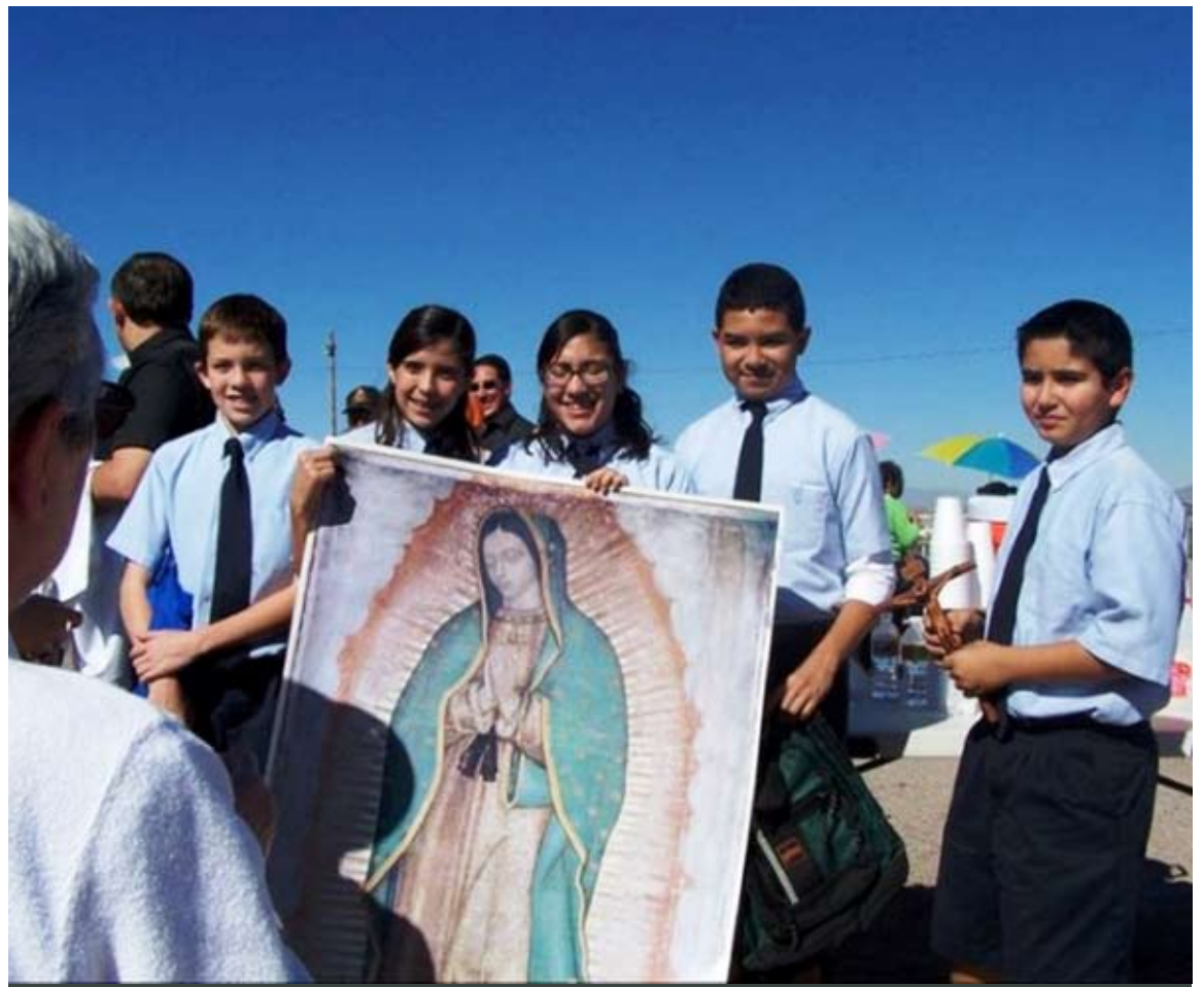
Alumnos de San Pío X sostienen un póster de Nuestra Señora de Guadalupe, defensora de los inmigrantes.