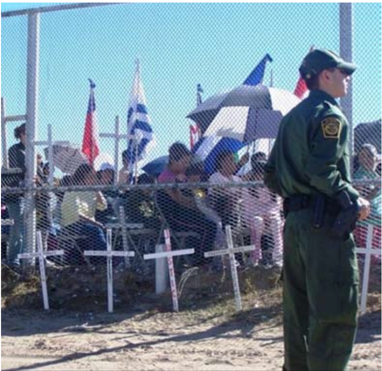
La celebración de la Santa Misa se lleva a cabo bajo la vigilancia de la patrulla fronteriza.