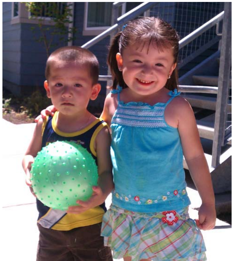
Unos niños juegan durante la bendición de la Villa San Juan Bautista el 31 de agosto