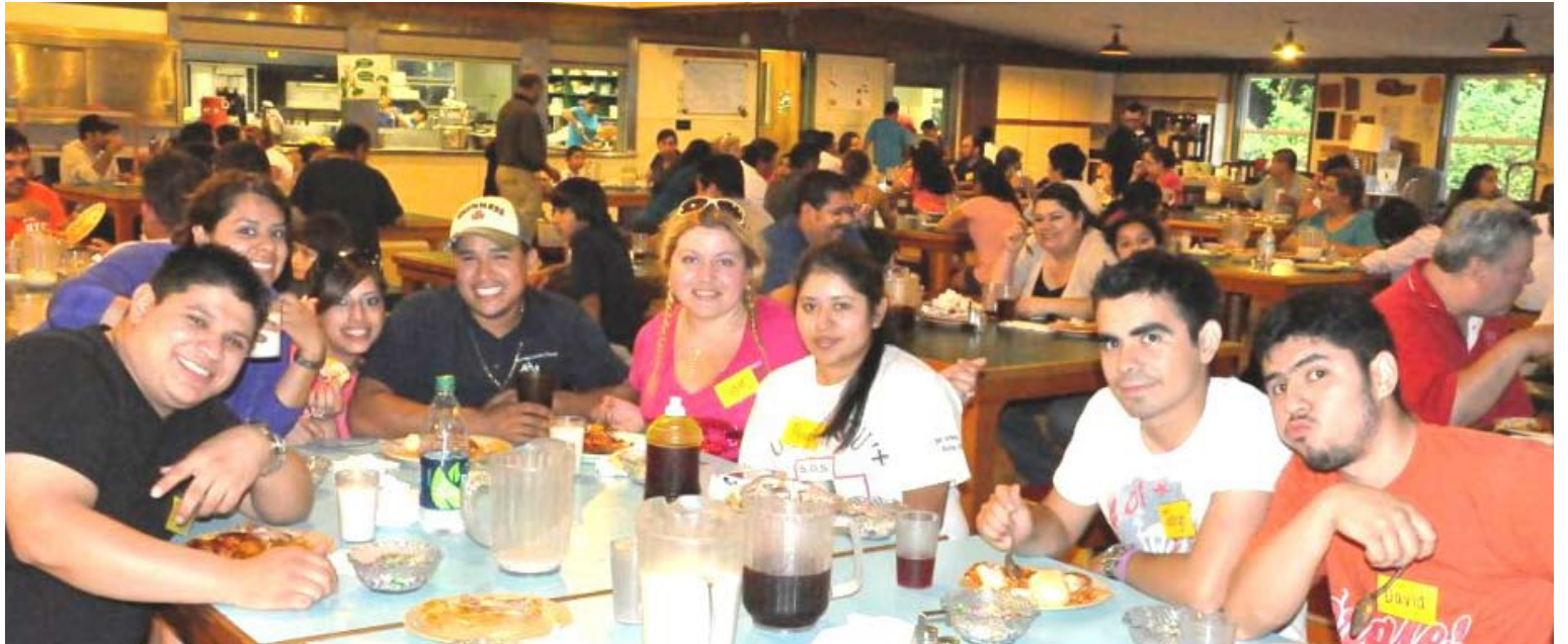
Jóvenes organizadores y familias disfrutaron de una rica cena patrocinada por los Cementerios Católicos de Arquidiócesis durante el campamento para familias hispanas el pasado 10 de septiembre.

El evento se llevó a cabo en el campamento arquidiocesano Don Bosco, ubicado en Carnation, WA, iniciando el viernes 9 de septiembre y culminando el domingo 11. Vale la pena mencionar que la planificación, organización y la facilitación del evento fueron realizadas en mayor parte, gracias al esfuerzo y vocación