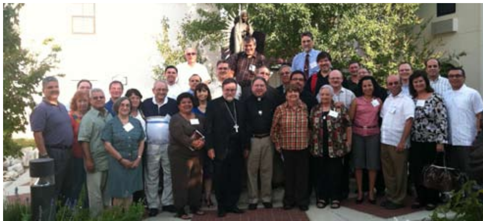
Líderes de diversas organizaciones no lucrativas de la pastoral hispana de Estados Unidos posaron para la foto bajo la protección de Nuestra Señora de Guadalupe en el Mexican American College en San Antonio, Texas.

Organizaciones católicas hispanas se reúnen para discernir su futuro