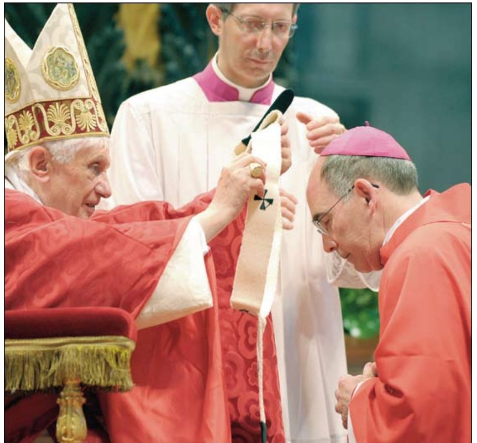
El 29 de junio de 2011: el Papa Benedicto XVI le otorgó el palio de lana simbólico al Arzobispo Sartain en una Misa en la Basílica de San Pedro en la fiesta de los Sts. Pedro y Pablo.

“Sin lugar a duda, es la oración”, dijo él. •