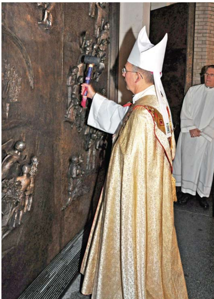
El 30 de noviembre de 2010, una noche antes de su instalación como arzobispo de Seattle, el Arzobispo Sartain ceremoniosamente toca la puerta de la Catedral de St. James.