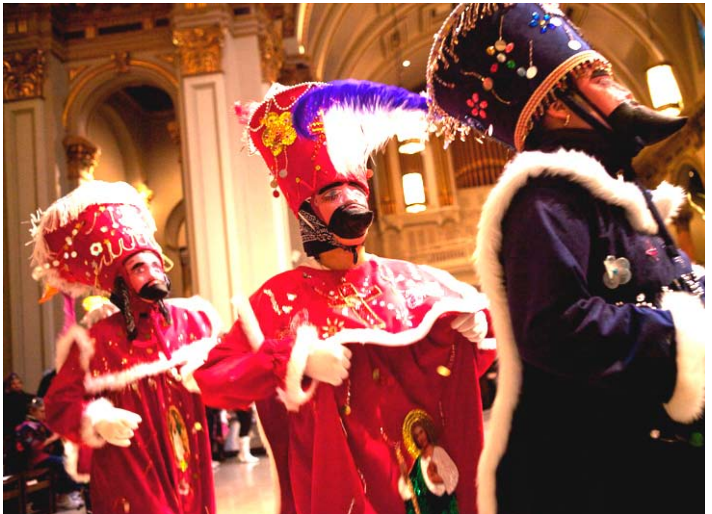
La “Danza de los Chinelos” encuentra su origen en la región montañosa de Tlayacapan de Morelos, México, y ahora continúa la tradición en la celebración de Nstra. Sra. de Guadalupe, Madre de las Américas en la Catedral de St. James en Seattle.

La primera vez que visité la Basílica de Nuestra Señora de Guadalupe y el Cerro del Tepeyac, aprendí otra gran verdad sobre la Virgen María: ella es una evangelizadora, quien alcanza a las personas de cada cultura y cada lengua,