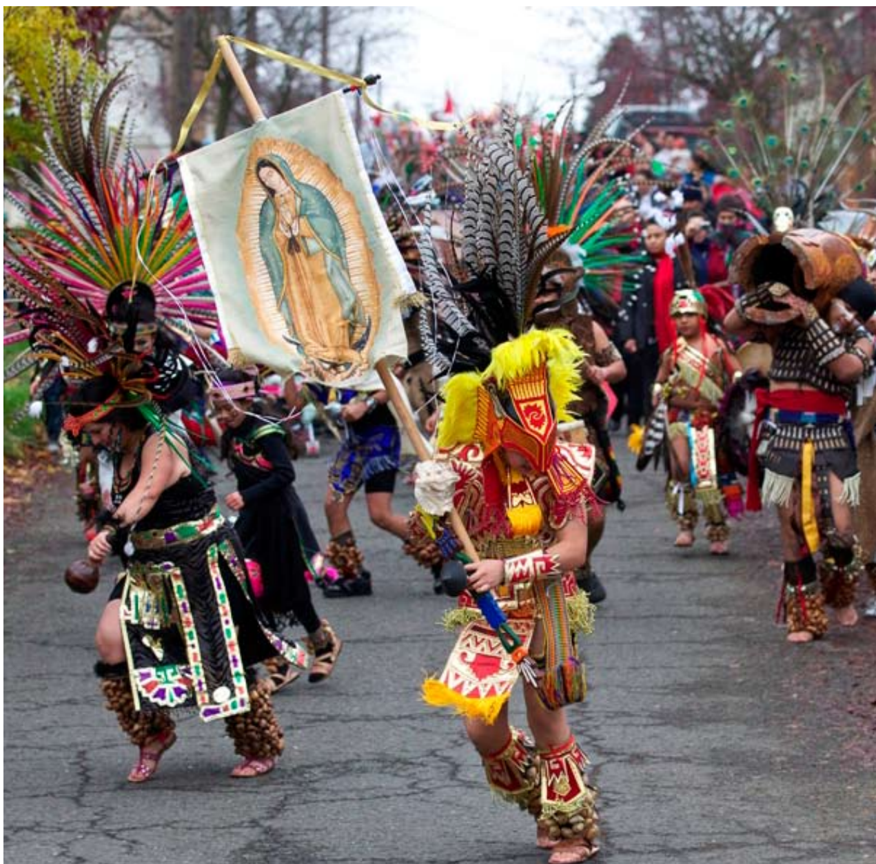
Los danzantes indígenas marchan en honor a Nuestra Señora de Guadalupe, rumbo a la Catedral de St. James, como si fueran las tribus de Israel, alabando y celebrando al son de tambores.

En seguida les comparto el sermón que prediqué el pasado 3 de diciembre de 2011, en ocasión de la Decimoséptima Celebración Arquidiocesana de Nuestra Señora de Guadalupe, Madre de las Américas en St. James: