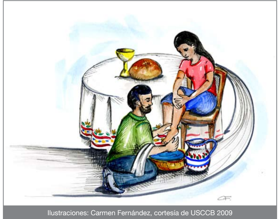
Ilustraciones: Carmen Fernández, cortesía de USCCB 2009

precioso de Dios. Ustedes se oponen a todo lo que destruya la vida, como por ejemplo el aborto, la eutanasia, la guerra injusta, la pena capital, la violencia doméstica y en los barrios, la pobreza y el racismo.