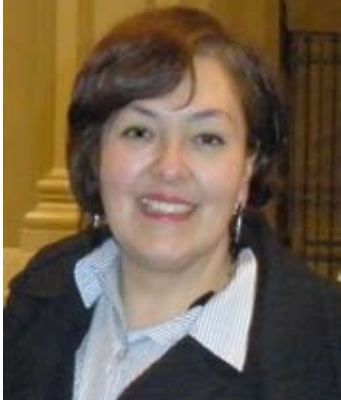
POR LUPITA ZAMORA SEATTLE

Los magos representan a todos aquellos que buscan, sin cansarse, la luz de Dios, siguen sus señales y, cuando encuentran a Jesucristo, luz de los hombres, le ofrecen con alegría todo lo que tienen.