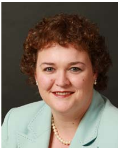
Por Mar Muñoz-Visoso

¡No hay duda que tales vocaciones están entre nosotros! Las conozco cada semana. •