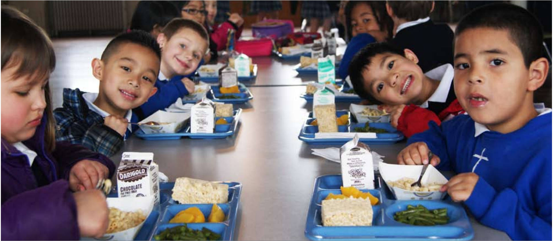
La escuela Santo Rosario en Tacoma será la primera escuela católica en el Estado de Washington en enseñar todas las materias en español e inglés cuando la Academia Juan Diego imparta instrucción preescolar y kinder este otoño.

El modelo de ‘inmersión bilingüe’ aumentará matriculaciones para servir mejor a Latinos