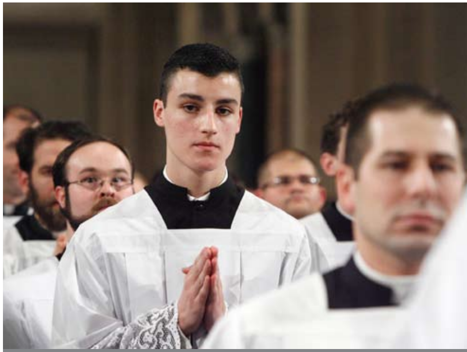
El Secretariado para el Clero, Vocaciones y Vida Consagrada de la Conferencia de Obispos lanzó un nuevo sitio web el 25 de abril de 2010 como un recurso para los laicos y el clero en la promoción de vocaciones. El sitio web de vocaciones puede encontrarse en www.ForYourVocation.org , y un sitio web en español en www.PorTuVocacion.org .