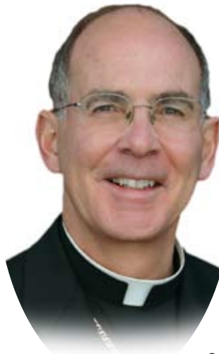
Excmo. J. Peter Sartain, Arzobispo de Seattle

Al final de cada celebración de la Misa, quienes han participado son comisionados y enviados. La traducción nueva del Misal Romano le ofrece al sacerdote o diácono varias opciones, todas enfatizan “el envío”. “Vayan en paz, la Misa ha terminado”. “Vayan y anuncien el Evangelio del Señor”. “Vayan en paz, glorificando al Señor con su vida”. “Vayan en paz”.