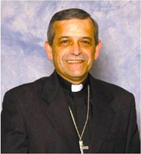
+Eusebio Elizondo M.Sp.S. Obispo Auxiliar de Seattle

S in duda alguna existen aun diversas manifestaciones de amor autentico en la humanidad. Independientemente de la cultura étnica, la época o las creencias religiosas; expresiones tales como: amor Paternal o Maternal; amor sponsal; amor fraternal; amor filial; amor de amistad; amor a la Patria; amor a la Sabiduría; amor al arte; y el amor a Dios nos lo han hecho palpable a través de los siglos. ¿Quién no ha experimentado la infinita paciencia de sus propios padres o, al convertirse en padres, ha ejercitado esa misma virtud a niveles de excelencia nunca sospechada?; ¿la generosa entrega de los esposos; el apoyo incondicional de un hermano(a)?; ¿la gratitud ilimitada de un hijo(a)?; ¿la