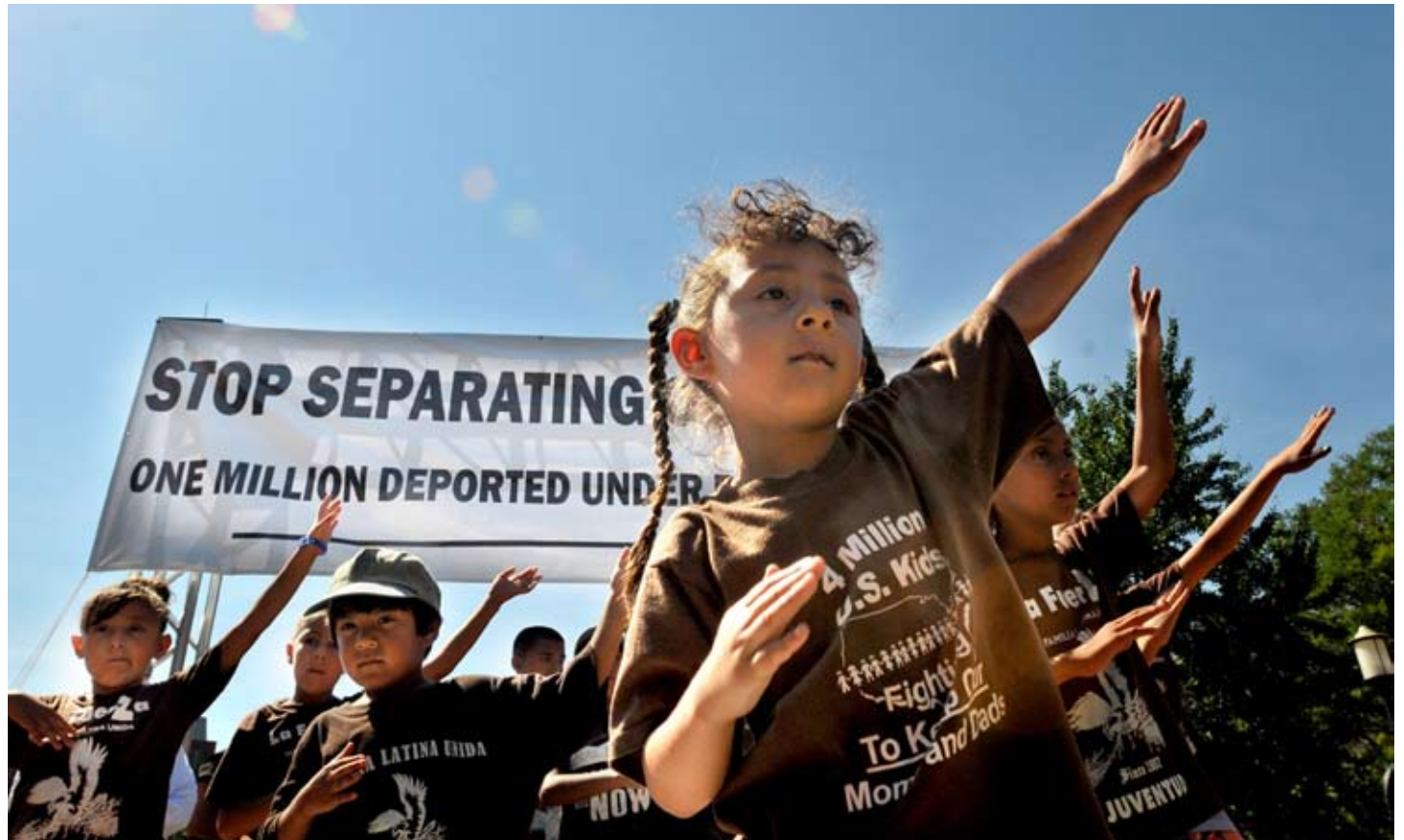
Un grupo de niños del área de Chicago participó de una demostración cerca de la Casa Blanca en Washington el pasado 26 de julio, instando acción en la política migratoria en Estados Unidos.

El obispo Elizondo dijo que unas cuantas prácticas migratorias del gobierno